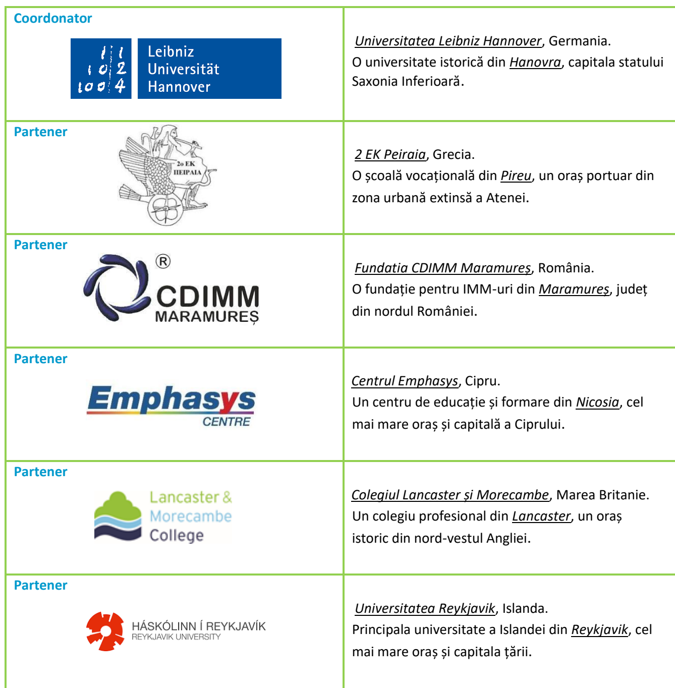
Tabelul 1.1: Organizațiile consorțiului Entre@VET

Entre@VETschools este un proiect de parteneriat strategic KA202 pentru educație și formare vocațională finanțat de Programul Erasmus+. Titlul complet al proiectului este „ Promovarea competențelor -cheie (antreprenoriat) printr-un program integrat de orientare în carieră și căi flexibile de învățare pentru studenții VET ”. Consorțiul proiectului este format dintr-o serie de instituții și organizații educaționale din întreaga UE; vă rugăm să consultați tabelul 1.1 de mai jos pentru lista completă a organizațiilor participante.