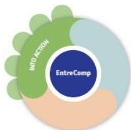
Tabelul 1.4: Cele 5 competențe „În acțiune”