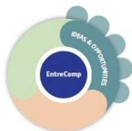
Tabelul 1.2: Cele 5 competențe „Idei și oportunități”